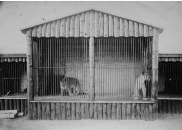
Løveburet i Holstebro Zoo. I buret til højre boede leoparten. Idag er vi alt andet end imponeret af dyrenes forhold, men efter datidens standarder herskede der yderst fine forhold i Holstebro Zoologisk have.