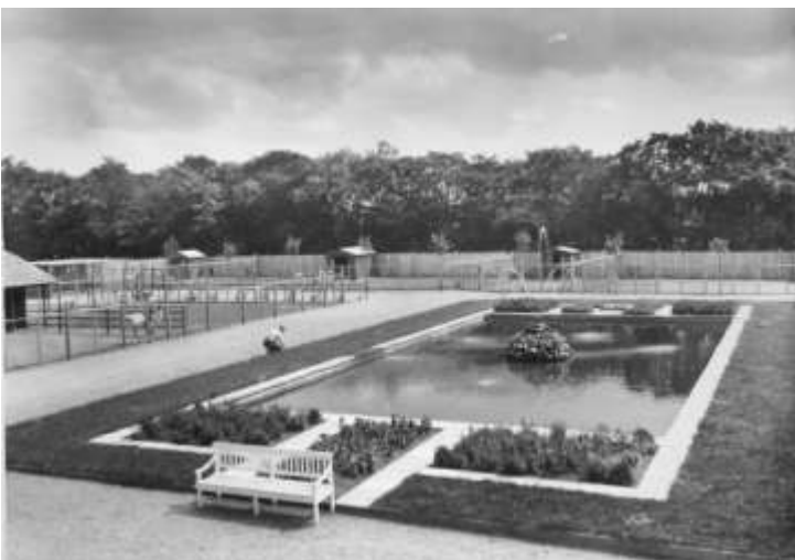
Strudse og vadefugle holdt til i "Prins Jørgens gård" der blev bygget i forbindelse med "Vestjydernes Udstilling" i 1934.

sjakal, en kvælerslange, en sydamerikansk Kasuar, vaskebjørne, diverse klovdyr, en australsk struds, traner, en krokodille samt en mængde andre dyr og fugle.