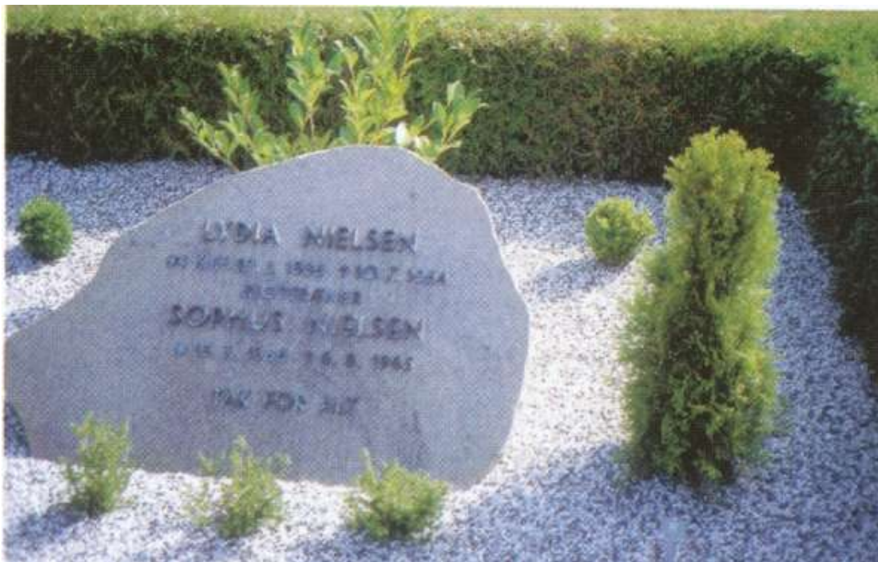
Gravstenen på Tvis kirkegård med, som satte denne historie i gang. Rigstræner-titlen må uvilkaarligt pirre nysgerrigheden hos forbipasserende.