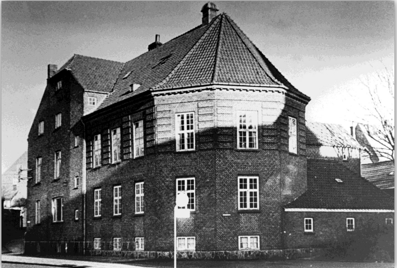
Højskolehjemmet set fra sydvest.

Holstebro Højskoleforening var et af de sidste resultater af det folkelige røre, der var så stærkt på egnen i 1880'erne, hvor især de grundtvigsk prægede bønder samledes om foreninger og institutioner af politisk, økonomisk og kulturel art. Mange havde været på højskole og var her blevet styrket i troen på at man kunne selv, samt at man havde nogle værdier der burde berettige til ligestilling med købstadens borgere. Blot skulle man stå sammen. Derfor stiftede man i 1881 Holstebro Dagblad, derfor etableredes indkøbsforeningerne RAI og RAV i 1885 og '86, og derfor stiftede man i 1885 egen valgmenighed i Holstebro. To år senere fulgte Holstebro Landmandsbank, og som en slags efternøler stiftedes så Højskoleforeningen i 1898. Alt sammen led i en kæde af ny selvbevidsthed.