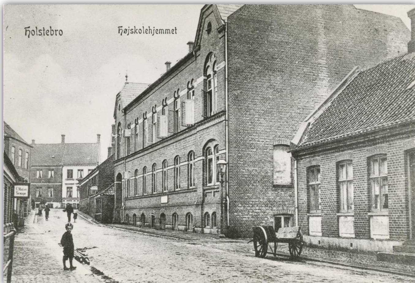
Højskolehjemmet set fra nordvest. I baggrunden ses Nørregade. Omkring 1900.

I den amputerede Skolegade, på hjørnet overfor indgangen til byens rådhus og bibliotek, ligger et toetages rødstenshus opført i solid muremesterstil. Det var her tingene skete engang. Adskillige årtier før Holstebro blev en "kulturby" var den røde bygning i Skolegade ramme om et folkeligt kulturliv, der satte sig spor i mangt og meget. Højskolehjemmet var en institution på mere end en måde, og lever som sådan stadig i manges bevidsthed. Det begyndte alt sammen officielt i februar 1898, men reelt blev spiren lagt i efteråret 1897.