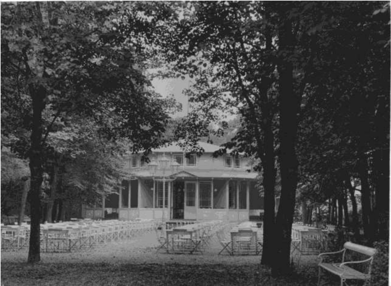
Så er borde og stole klar til at modtage sommergæster foran pavillonen, der stadig står med de åbne kabinetter, som oprindeligt prægede bygningen. Bemærk gaslampen, der daterer billedet til først i århundredet.